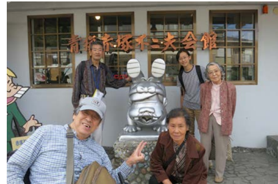
青梅にある赤塚不二夫会館を訪れたのだ～