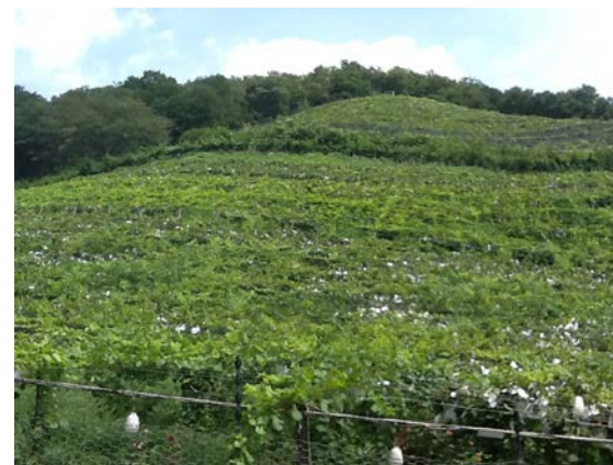
ぶどう畑でさわやかな風を感じました。