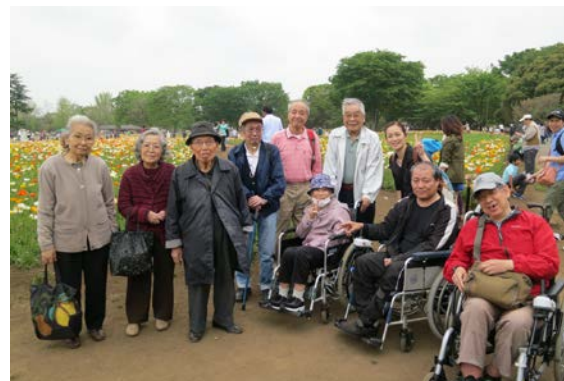
昭和記念公園で記念撮影